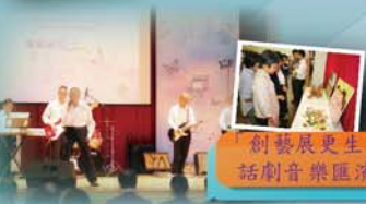
「創發展更生」話劇音樂匯演