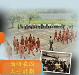
面晤在囚人士計劃