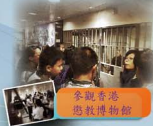
參觀香港懲教博物館