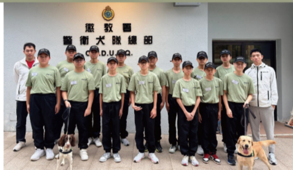
▲ 中學生參觀本署警衛犬隊總部，了解警衛犬隊的日常工作。

「多元智能躍進計劃」展現本署致力促進青少年全面成長，透過紀律訓練與國民教育融合，培育兼具國家意識與領袖才能的社會棟樑。