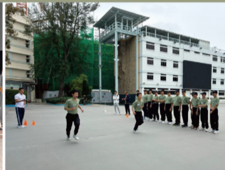
▲ 中學生在學院接受體能訓練，有助培養堅韌意志及團隊協作精神。