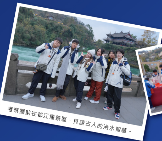
考察團前往都江堰景區，見證古人的治水智慧。