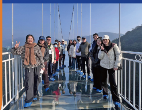
▲領袖學員前往「三百山景區玻璃天橋」，實地考察東江水發源地，從中學習飲水思源的重要意義。

懲教先鋒領袖於上月20至23日派出四名領袖學員參加由香港各界青少年活動委員會舉辦的「探古尋源·東江之旅」雙向交流團，聯同其他香港青年代表一起開展探古尋源之旅。