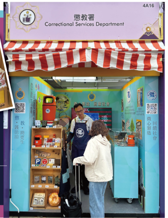
▶ 本署參與由中華廠商會舉辦的「第59屆工展會」，售賣多款由在囚人士製作的手工藝品。