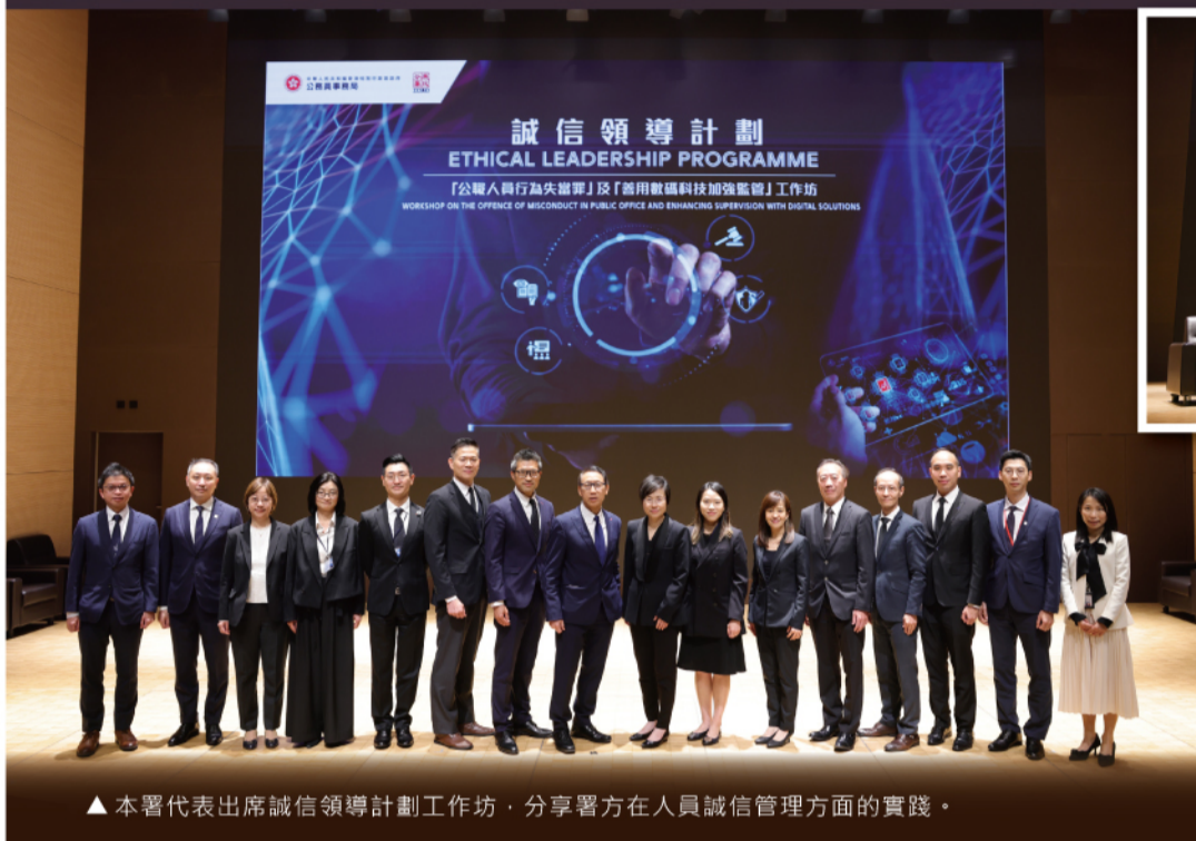
▲ 本署代表出席誠信領導計劃工作坊，分享署方在人員誠信管理方面的實踐。