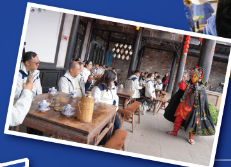
▲考察團前往恩陽古鎮觀賞川劇演出，深入認識「川劇變臉」這項國家級非物質文化遺產的藝術精髓與文化價值。