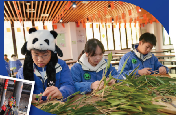
▲領袖學員在臥龍中華大熊貓苑神樹坪基地體驗飼養員工作，為大熊貓準備飼料，深刻認識生態保育的重要性。