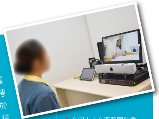
▲ 在囚人士在懲教院所參與視像招聘會。

本署於上月10日舉辦「愛心僱主」視像招聘會，為即將於三個月內獲釋的在囚人士提供就業配對機會。活動共安排超過40名來自八間懲教院所的在囚人士參與，本署安排僱主在旺角、筲箕灣及沙田的多用途家庭及更生服務中心，透過視像會議形式進行面試。助理署長(更生事務)唐恂亦前往各多用途家庭及更生服務中心視察視像招聘會的情況。