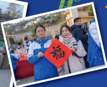
▲領袖學員前往四川省南江七一中學與該校學生進行文化交流，建立了跨地域友誼。