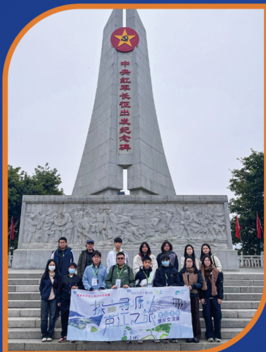
▲領袖學員參與由香港各界青少年活動委員會舉辦的四日三夜「探古尋源·東江之旅」雙向交流團。