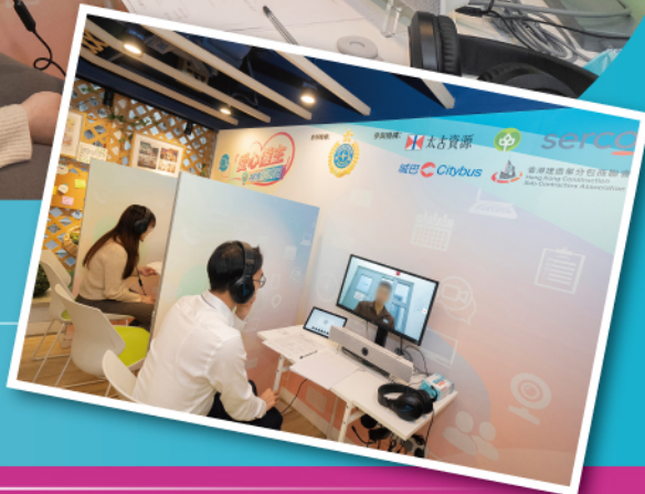
▶ 僱主在筲箕灣多用途家庭及更生服務中心透過視像會議形式與在囚人士進行面試。