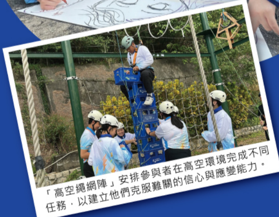
「高空繩網陣」安排參與者在高空環境完成不同任務，以建立他們克服難關的信心與應變能力。

懲教先鋒領袖計劃早前於大嶼山的賽馬會銀礦灣營舉辦為期兩日一夜的領袖訓練營。活動共26名青少年參與，當中包括中學生及現有的懲教先鋒領袖學員。是次訓練營旨在強化參與者的領袖才能、團隊合作精神及解難能力，同時培養更多青少年成為懲教先鋒初級領袖。