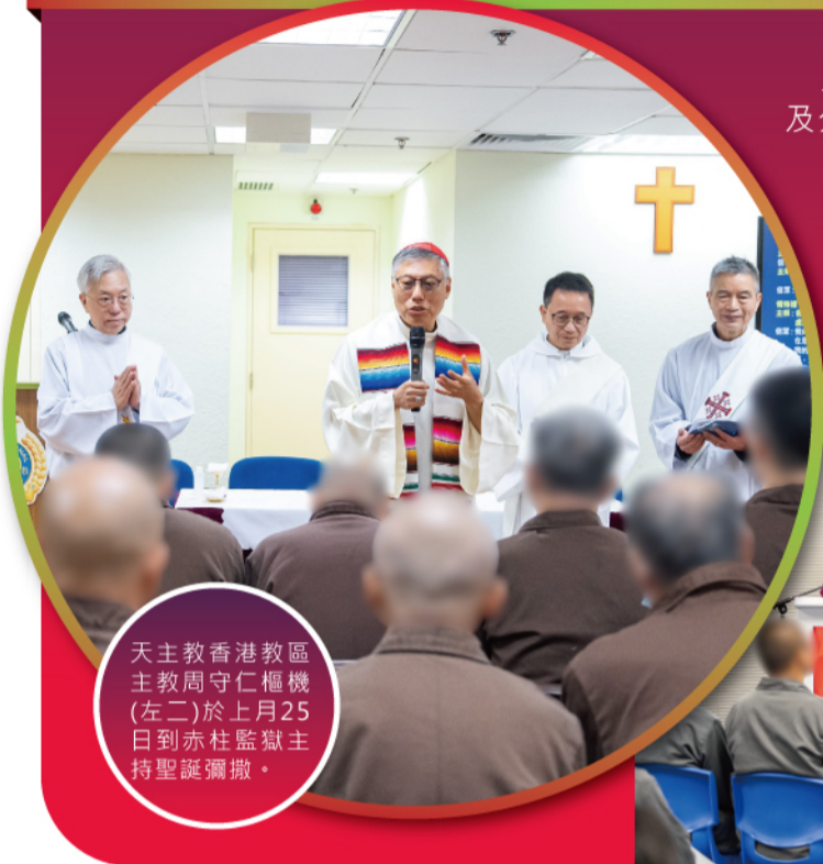
天主教香港教區主教周守仁樞機(左二)於上月25日到赤柱監獄主持聖誕彌撒。