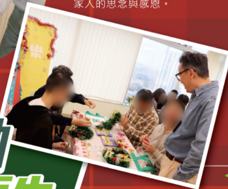
▲勵敬懲教所的在囚青少年透過製作聖誕心意卡來表達對家人的思念與感恩。

本署更生事務組早前於院所內外分別舉辦了三場聖誕親子活動，讓在囚及受監管青少年與家人共度溫馨節日，強化家庭支持對更生歷程的重要性。