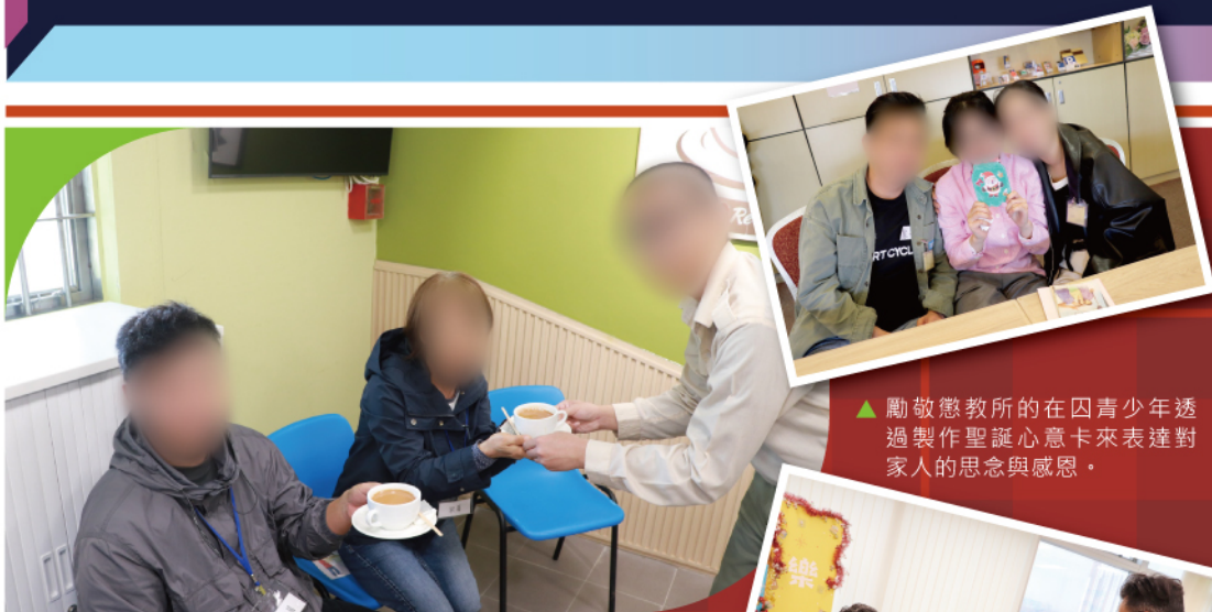
▲沙咀懲教所的在囚青少年為家人親手沖泡奶茶，感謝家人一直以來的不離不棄。