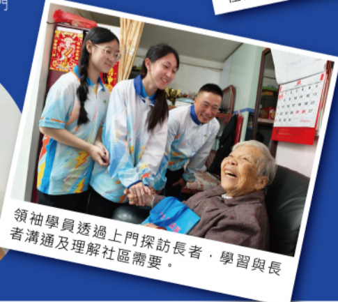
領袖學員透過上門探訪長者，學習與長者溝通及理解社區需要。