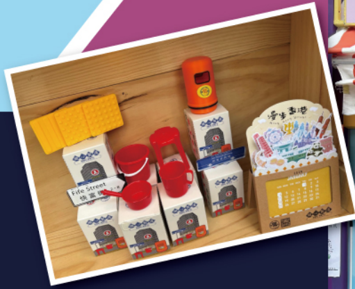
▲「徵心製造」與香港老字號品牌「紅A」聯乘推出盲盒產品。

本署透過參與戶外大型展覽，讓市民親身認識在囚人士的創意與技能，有助推動社會對更生工作的理解與支持。