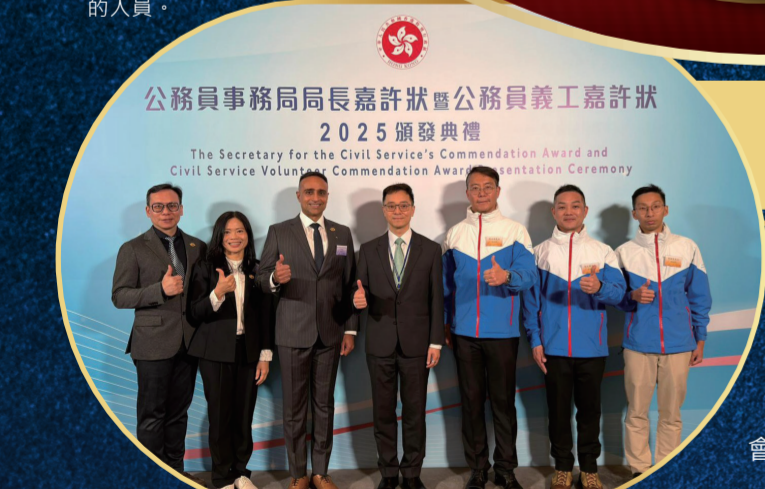
公務員事務局局長嘉許狀及公務員義工嘉許狀 2025 頒發典禮