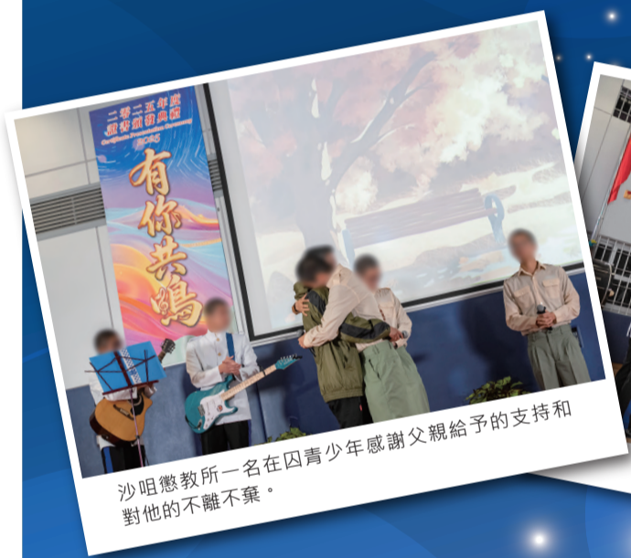
沙咀懲教所一名在囚青少年感謝父親給予的支持和對他的不離不棄。