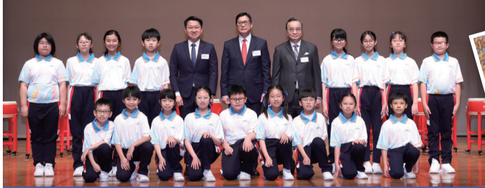
在圍牆以外，本署懲教先鋒計劃轄下的Captain Gor同學會會員亦有參與計劃，並於香港浸會大學大學會堂舉行鼓樂匯演，保安局局長鄧炳強(後排中)為匯演擔任主禮嘉賓。

本署積極為在囚人士提供不同中華文化活動，包括中國藝術體驗，協助他們認識祖國文化、建立正確價值觀，以及提升國民身分認同。早前，在囚人士參與「樂繫家國」及「藝脈中華」兩項活動，透過學習各種中國藝術的過程，領略中華文化的深厚底蘊，為更生之路注入自信與希望。