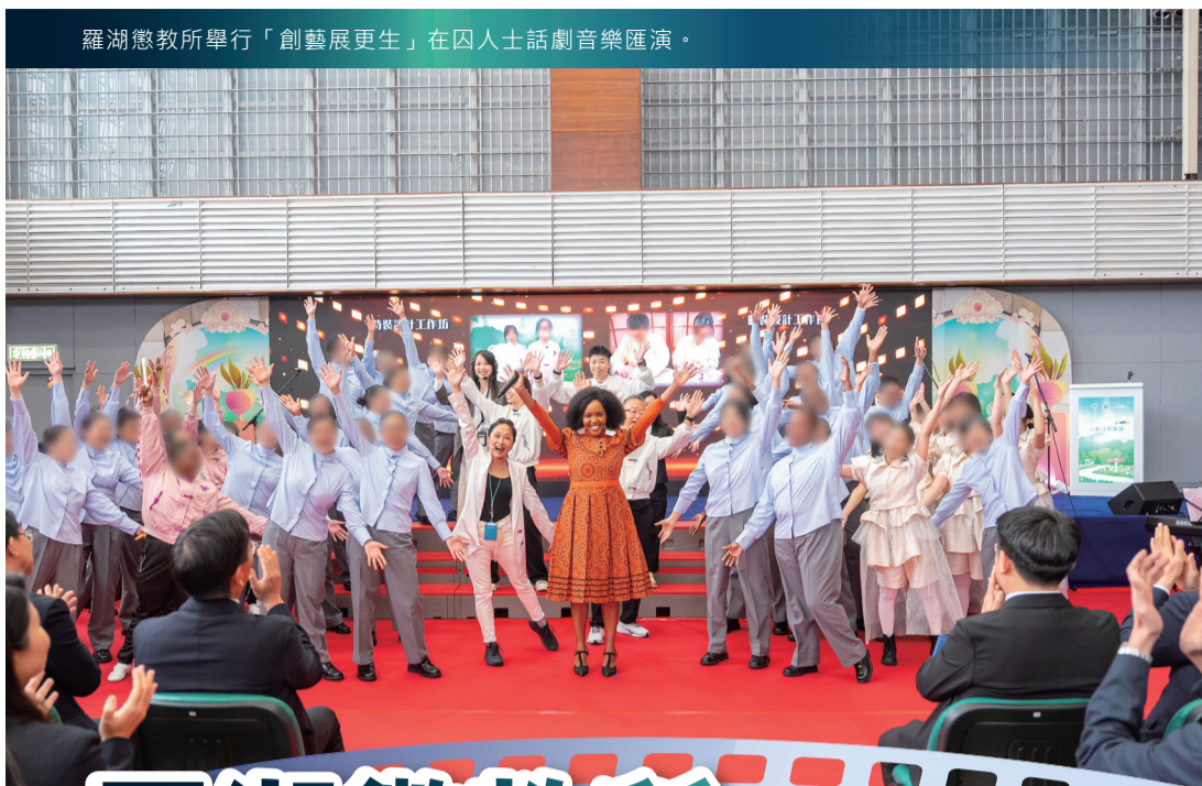
羅湖懲教所舉行「創藝展更生」在囚人士話劇音樂匯演。

本署於3月4日邀請來自5間學校超過150名中學師生到羅湖懲教所，欣賞懲教先鋒計劃下的「創藝展更生」在囚人士話劇音樂匯演，並邀請香港山西總會會長吳騰擔任主禮嘉賓。