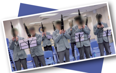
▲參與課程的在囚人士表現積極，一同練習以磨合節奏。