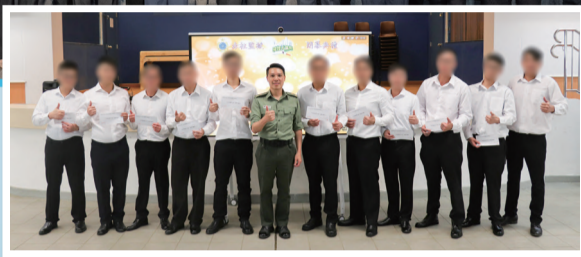
院所舉辦嘉獎禮，嘉許成功戒煙的在囚人士。

第16屆「戒煙大贏家」無煙社區計劃由香港吸煙與健康委員會(委員會)聯同香港大學護理學院及香港大學公共衛生學院舉辦。本署共有5個院所(赤柱監獄、羅湖懲教所、塘福懲教所、壁屋監獄及白沙灣懲教所)合共49名在囚人士參與計劃。其間，本署人員與香港大學職員向參與計劃的在囚人士提供戒煙輔導、一氧化碳呼氣測試及口水測試，鼓勵並協助他們戒煙。