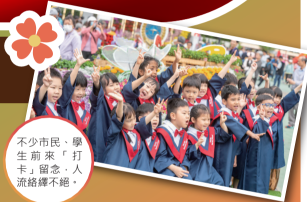
不少市民、學生前來「打卡」留念，人流絡繹不絕。

園林造景設有多個以彩虹和蝴蝶為題材的特色「打卡點」，供市民拍照留念。展出的花卉及裝飾擺設均由接受過園藝及各項工藝訓練的在囚人士親手栽種及製作，藉此展示在囚人士接受訓練的成果及宣揚更生同行的理念。造景設計亦融入了「愛護家國、奉公守法、遠離毒品、支持更生」的社區教育元素。