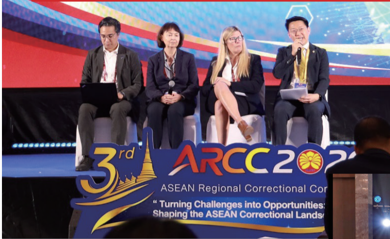
▲ 副署長(更生及管理)吳超覺(右一)在會議上發表演講，並與其他與會者進行交流。

為期5天的會議設有全體會議、專題分組討論及參觀懲教設施等環節，讓與會者深入交流，進一步加強經驗互鑑及跨地域的專業聯繫。