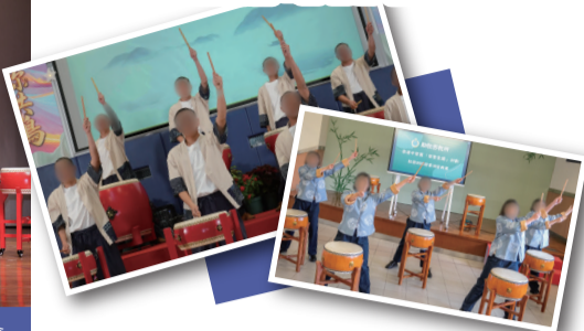
▲在囚青少年自去年起參與「樂繫家國」計劃，並在證書頒發典禮中表演鼓樂，展現改過自新的決心。