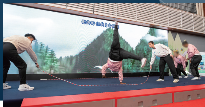
▲羅湖懲教所在囚人士為到訪的來賓表演花式跳繩。

在兩場典禮的分享環節中，在囚人士分享了更生路上的點滴，以及犯罪所帶來的沉重代價。有沙咀懲教所在囚青少年感謝家人的不離不棄及懲教人員的鼓勵，協助他重回正軌。他立志積極裝備自己，為重投社會作好準備；而羅湖懲教所有在囚人士分享她在獄中決心改過，並重拾書本，為日後重新融入社會作好準備。她的家人更帶同其年幼女兒到場支持，並分享見證她正面改變的喜悅，場面感人。