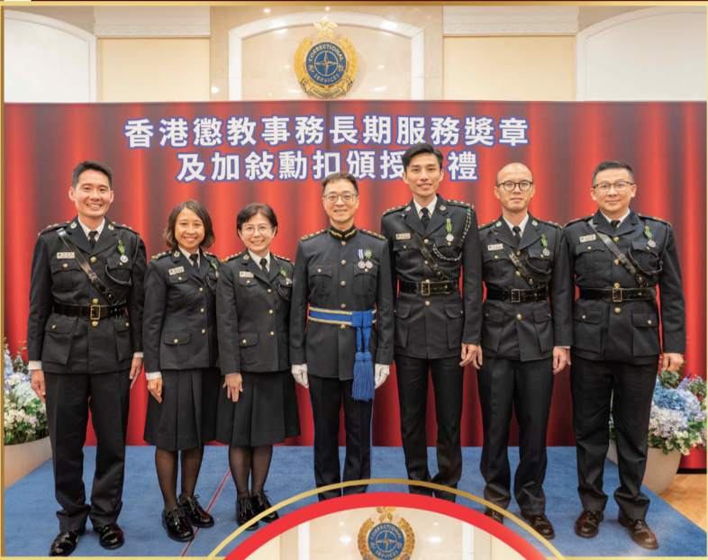
香港懲教事務長期服務獎章及加敘勳扣頒授典禮

香港特別行政區政府向在懲教署服務滿18、25、30及33年並表現良好的人員分別頒授香港懲教事務長期服務獎章、第一、第二及第三加敘勳扣。長期服務獎章正面為洋紫荊圖樣，背面則為指南針，標誌着懲教署明確清晰的目標和路向。署方今年共有385名人員獲頒獎章及加敘勳扣，名單如下：