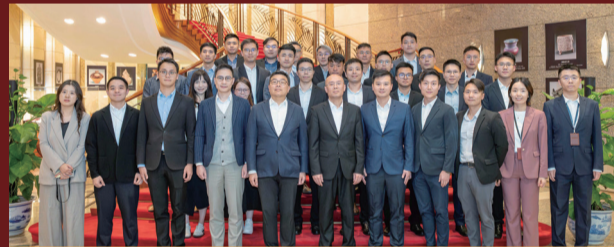
本署人員到訪特派員公署，透過參觀「新中國外交歷程圖片展」深入了解國家外交歷程與發展成就。

展覽展出大量記載國家重要的外交歷史時刻及發展里程碑的珍貴資料。人員透過歷史相片及文獻，重溫國家外交大事與發展成就，進一步加強民族認同感，並加深對國家外交工作的認識，了解祖國和平發展的方針，以及為構建人類命運共同體所作的努力。