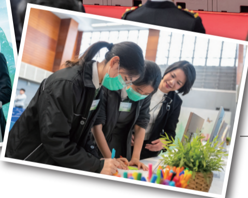
在囚人士在分享環節以自身經歷告誡學生要奉公守法和遠離毒品。