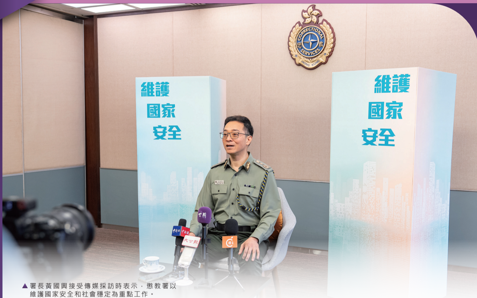
▲署長黃國興接受傳媒採訪時表示，懲教署以維護國家安全和社會穩定為重點工作。