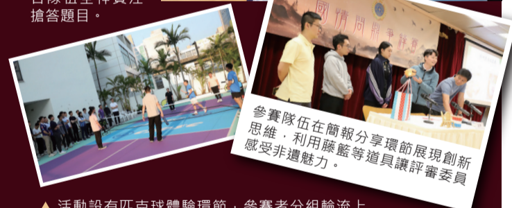
▲ 活動設有匹克球體驗環節，參賽者分組輪流上場，學習基本握拍、發球與網前截擊技巧。