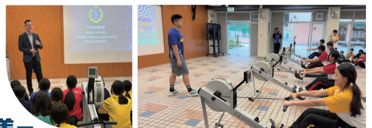
▲ 體適能隊成員指導學生室內划艇運動的技巧。