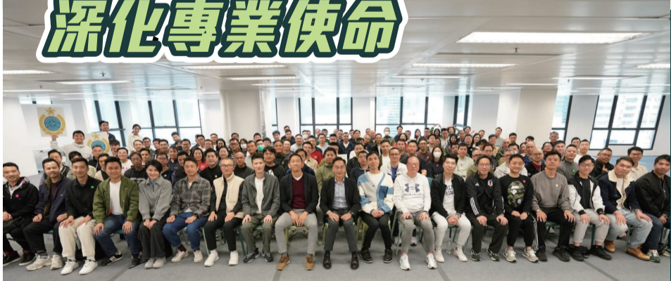
助理署長(更生事務)唐恂(前排中)到場向一眾同事作出訓勉。

更生事務處於3月12日及13日舉辦退修營，退修營提供多元化的團隊任務與挑戰活動，有逾280名更生事務處同事參與。