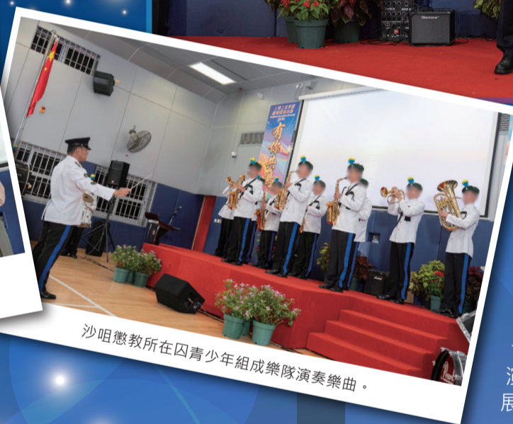
沙咀懲教所在囚青少年組成樂隊演奏樂曲。

主禮嘉賓香港陸群助更生協會董事會主席趙芝勝博士表示，香港陸群助更生協會一直支持懲教署的更生工作，並設立「陸群自強不息教育基金」，為有需要的在囚人士在教育及職業訓練方面提供資助。他勉勵在囚人士只要勇敢面對困難，最終都會實現自己的理想。典禮上，在囚青少年表演舞獅、中國鼓、樂隊演奏和歌唱等項目，展示學習成果及對未來的期盼。