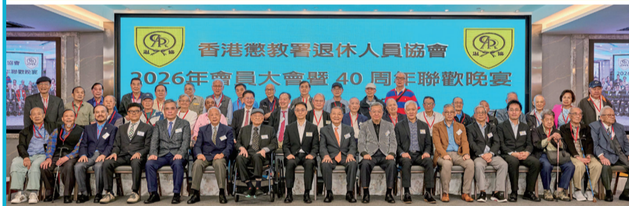
▲ 署長黃國興(前排左八)出席退協40周年聯歡晚宴，並與一眾嘉賓合照留念。

退協除了作為部門與退休同事的聯繫橋樑外，亦會關心和探訪高齡會員，並協助部門推廣懲教人員的專業形象。退協執行委員將繼續努力，推動會務蒸蒸日上。