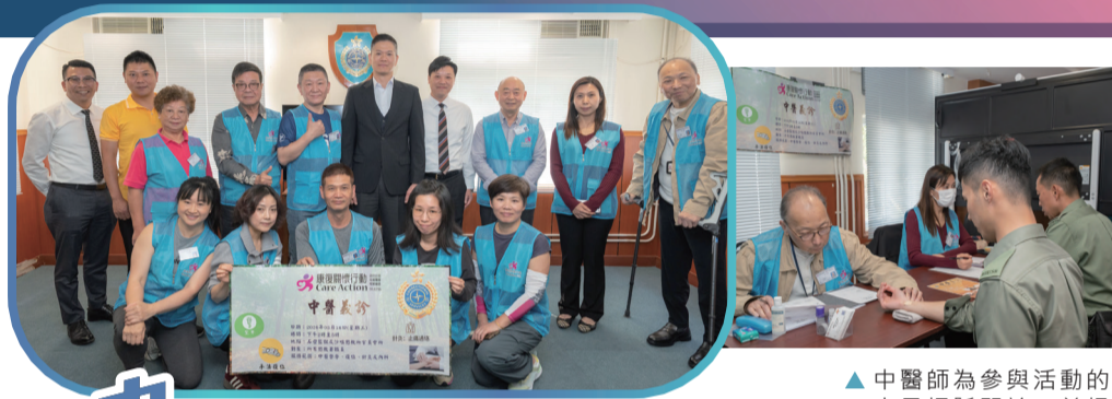
▲ 助理署長(人力資源)何國文(後排右五)到場支持活動並與一眾義診中醫師及治療師拍照留念。

生活中的壓力有時來自對周遭事物的無力感。要對抗這種疲憊，最好的方法就是完成一些小目標。無論是親自下廚準備一頓飯，甚至是整理好家中的一個角落，這種看得見、摸得到的成就感，能為心理注入最直接的能量，讓我們感到自己才是生活的主人。