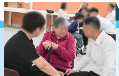
▲ 在囚人士家人出席院所舉辦的嘉獎禮，向成功戒煙的在囚人士給予支持。

另外，助理署長(行動)陳少恒在3月12日亦代表本署出席由委員會舉辦的「戒煙大贏家」無煙社區計劃頒獎禮，嘉許成功戒煙的參賽者，以表示對活動的支持。本署自2018年起參與「戒煙大贏家」無煙社區計劃，一直配合政府的控煙政策，積極鼓勵並協助在囚人士戒煙，讓他們遠離煙草禍害。