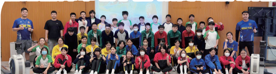
本署代表到訪寶覺中學舉辦「懲心同行」活動，凝聚青少年活力，協助他們建立正向生活。