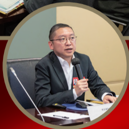
港區全國人大代表林至穎擔任「《白皮書》及兩會精神分享會」主講。