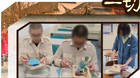
▲在囚青少年在體驗課上親手製作紙張，並發揮藝術創意，在手工紙上添加乾花、棉花、顏料等材料，設計獨一無二的掛畫。

教育分組於3月13日至19日，分別在勵敬懲教所、沙咀懲教所及壁屋懲教所舉辦造紙體驗課，讓在囚青少年透過親身實踐，認識中國古代四大發明之一的造紙術，從而加深對中華文化及古人創造力和智慧的理解。