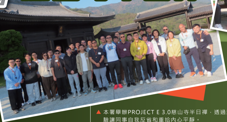
▲ 本署舉辦PROJECT E 3.0慈山寺半日禪，透過靜修體驗讓同事自我反省和重拾內心平靜。

為向人員推廣部門道德操守及健康均衡生活文化，本署於3月12日及19日舉辦PROJECT E 3.0慈山寺半日禪活動，讓來自各院所的同事報名參與，透過靜修體驗，自我反省，放鬆身心。