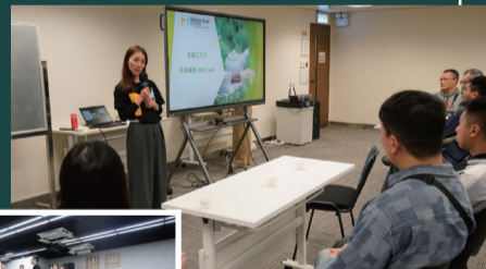
同事參與團隊建立活動及中國茶道工作坊，藉此加強團隊精神及認識中國文化。

是次退修營以「中國文化、科技與更生的探索之旅」為主題，活動種類多元化，既有富挑戰性的新科技項目，亦有國家傳統文化體驗環節，包括室內高爾夫模擬體驗、團隊建立活動及中國茶道工作坊等。同事在輕鬆的氛圍中分享工作點滴，讓各人得以交流更生工作的經驗及智慧，並藉活動深植愛國精神。