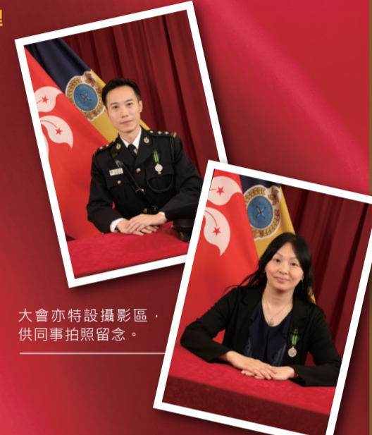
大會亦特設攝影區，供同事拍照留念。