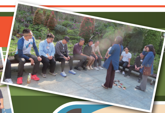
◀ 同事在山林療癒陪伴員的指導下，專注呼吸和五感，有助舒緩身心壓力。