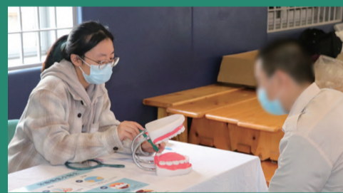
◀ 在囚青少年接受口腔衛生教育，有助提升他們的健康護理水平。