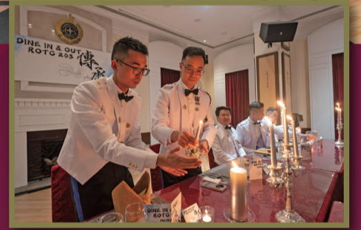
席間進行了「薪火相傳」儀式，由署長黃國興（左二）將燭光傳燃至主任學員，寓意將懲教精神代代傳承。

在分享環節中，署長及一眾首長級人員向各學員分享寶貴的實務經驗，寄語學員要從實踐中學習，並強調懲教工作的核心，不僅確保羈押環境安全穩妥，更要肩負更生使命，幫助在囚人士改過自新及融入社會。第203期懲教主任學員將於6月派駐各院所，為本署注入新動力，共同守護香港刑事司法體系的最後防線。