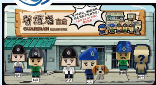
▲「徵心製造」於5月推出「守護者」(GUARDIAN)系列盲盒。

「徵心製造」5月推出全新「守護者」(GUARDIAN)系列公仔盲盒，將日常並肩同行的懲教人員身影化身為「得意」公仔。不論是身穿經典綠色制服的KARL，還是美麗動人的Madam晴晴，每一款均還原負責不同崗位的懲教人員模樣。