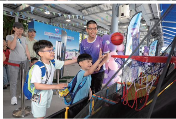
市民參與以國家安全為主題的攤位遊戲。

懲教署體育會的「徵心製造」慈善網上禮品銷售平台亦在開放日現場設立銷售點，售賣多款「全民國家安全教育日」限定產品，在推廣國家安全的同時，鼓勵市民支持在囚人士更生。