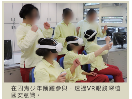
在囚青少年踴躍參與，透過VR眼鏡深植國安意識。

更生事務組在勵敬懲教所舉辦國家安全主題虛擬實境遊戲，讓在囚青少年從全新視角認識國家安全的重要性。