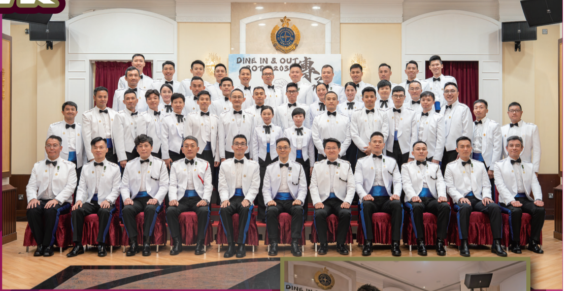
第203期懲教主任學員舉行傳統聚餐「Dine in & dine out」，署長黃國興（前排中）、一眾首長級人員和各學員合照留念。

在分享環節中，署長及一眾首長級人員向各學員分享寶貴的實務經驗，寄語學員要從實踐中學習，並強調懲教工作的核心，不僅確保羈押環境安全穩妥，更要肩負更生使命，幫助在囚人士改過自新及融入社會。第203期懲教主任學員將於6月派駐各院所，為本署注入新動力，共同守護香港刑事司法體系的最後防線。