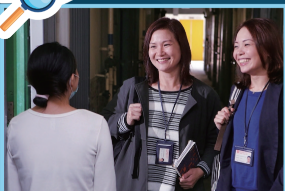
研究指出，懲教人員與受監管者建立融洽和互信的關係，對預防重犯有關鍵作用。

現時，部分刑滿或提早獲釋的人士，須按法例要求接受監管，目的是協助他們逐步重返社會，適應新生活。