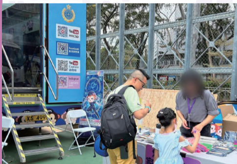
▲ The "National Security Education Special Edition of Rehabilitation Express" promotional vehicle was parked at Victoria Park and the CSD arranged for a supervisee to take part in the activity and facilitate the public to participate in the games to disseminate national security messages.

The theme of this year's National Security Education Day is "Proactively Align with the 15th Five-Year Plan Follow a Holistic Approach to Development and Security". The open day featured game booths centred on the 15th Five-Year Plan and national security, aimed at deepening the public's understanding of the Plan and national security, as well as strengthening their sense of national identity. In response to the publication of the white paper on "Hong Kong: Safeguarding China's National Security Under the Framework of One Country, Two Systems" by the State Council Information Office earlier, the event also included a related game booth to enhance the public's understanding of the white paper in an interesting and interactive way.