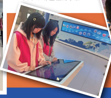
領袖學員透過參觀惠東海龜國家級自然保護區，親身見證國家對保育瀕危物種的重視與成果。