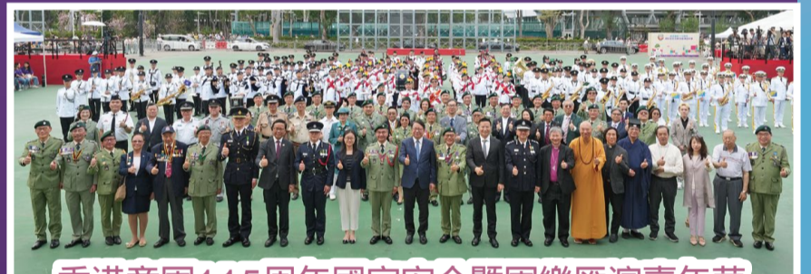
香港童軍115周年國家安全暨軍樂匯演嘉年華

本署步操樂隊應香港童軍總會邀請，於4月12日出席在維多利亞公園硬地足球場舉辦的「香港童軍115周年國家安全暨軍樂匯演嘉年華」擔任表演團體，透過音樂宣揚維護國家安全的信息。