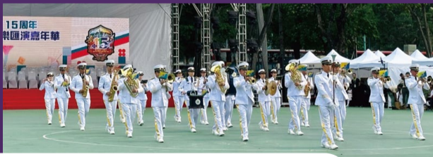
▼本署步操樂隊獲邀擔任表演團體，以鏗鏘激昂的樂韻傳遞愛國情懷。

未來，本署將以勇於擔當的態度實踐使命，不斷提升治理效能，致力維護高水平安全和高質量發展，助力香港融入國家「十五五」規劃，共同續寫獅子山下新傳奇。