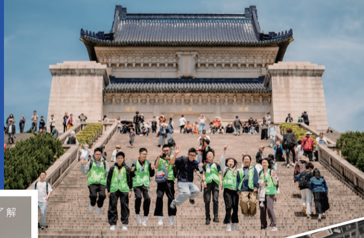
透過導賞員的專業講解，領袖學員加深對抗戰歷史的認識。