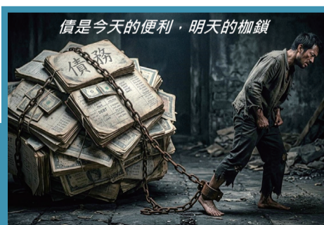
債是今天的便利，明天的枷鎖

參考資料：《懲教署誠信管理手冊》第8章、《工作守則》/《工作程序》第20-01及20-02