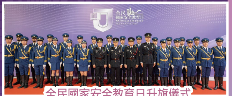
全民國家安全教育日升旗儀式

為迎接第11個「全民國家安全教育日」，本署步操樂隊於這意義深遠的教育日前夕參與了「香港童軍115周年國家安全暨軍樂匯演嘉年華」，透過樂曲向社會大眾推廣國家安全的重要性及使命。於4月15日，本署派員參與保安局舉辦的升旗儀式。同日，首長級人員與本署轄下青少年制服團隊懲教先鋒領袖學員參與「全民國家安全教育日」開幕典禮暨主題講座，來自不同組別的人員亦於當日參加了以「《「一國兩制」下香港維護國家安全的實踐》白皮書」為主題的國安法律論壇，一同全面深化維護國家安全的意識。